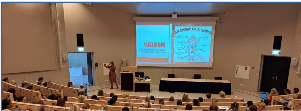
Introductiedag studenten i.o. & stagiairs verpleegkunde LUMC | september 2023

Het EPA gericht opleiden roept bij menigeen vragen op , vooral omdat nog niet alles landelijk helemaal uitgekristalliseerd is. Om het studiejaar goed te starten hebben we een aantal zaken voor u op een rij gezet .